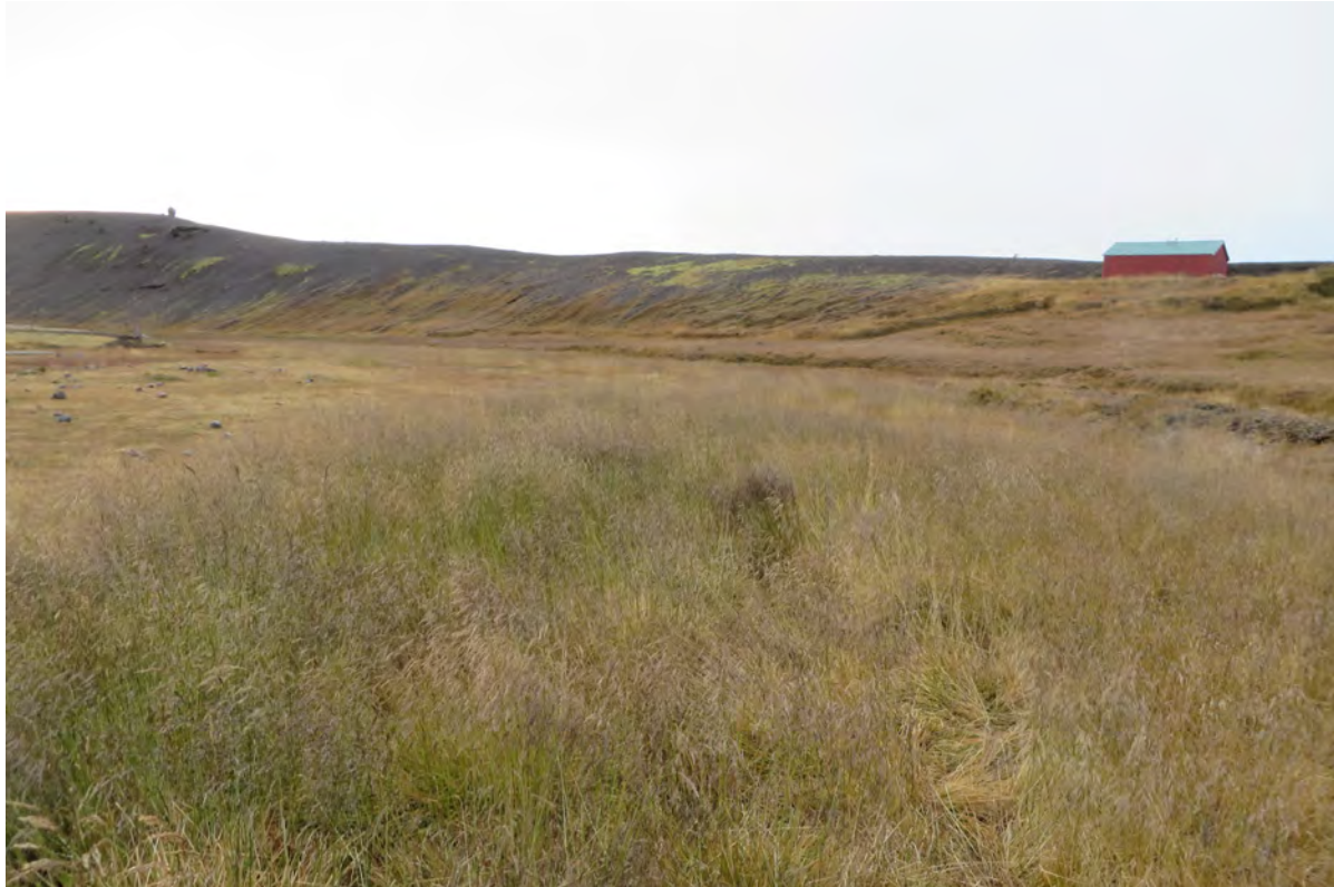
17. mynd. Snarrótarpuntur er hávaxinn grastegund og myndar hér kraga meðfram tjaldsvæðinu í Ásgarði. 29. september 2016.