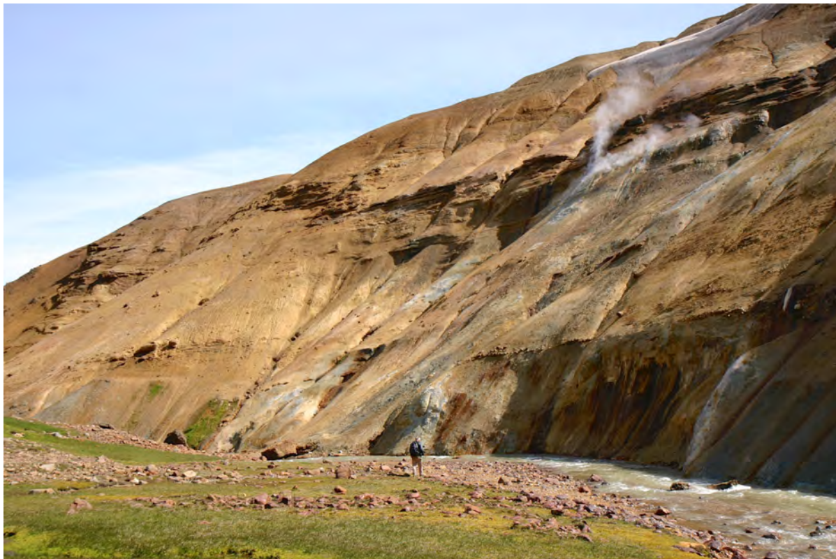
5. mynd. Ummyndað vatnaset við Árskarðsá vestast í Hveradölum. Setið hefur safnast fyrir í öskjuvatni á ísöld. 4. júlí 2008.