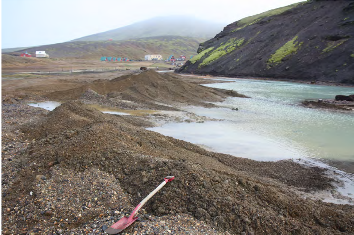
8. mynd. Framburður Árskarðsár einkennist af háhitaummynduðu seti með líparít- og móbergsmulningi. Ljós. Kristján Jónasson, 29. sept. 2016.