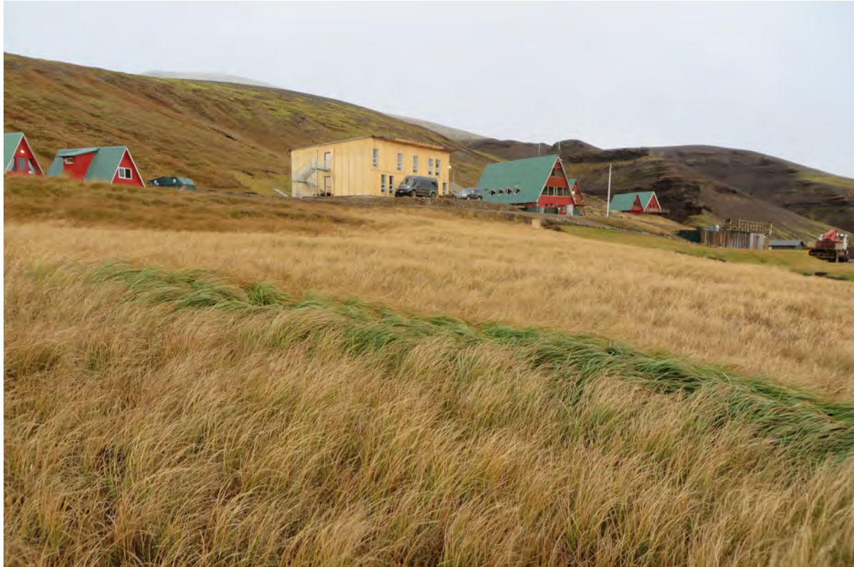
22. mynd. Tjarnastör (ljósi gróðurinn á myndinni) og gulstör (dökkgræn rönd) eru hávaxnar starir og skera sig úr frá öðrum votlendis- og staragróðri. Hvorug þessara tegunda höfðu verið skráðar áður innan athugunarsvæðisins. 29. september 2016.