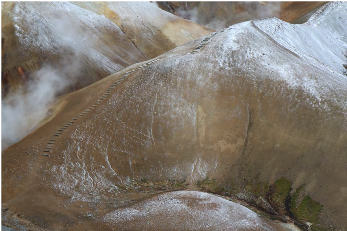
26. mynd. Tröppur hafa verið haganlega lagðar í göngustíga í Vesturdöllum. Ljós. Kristján Jónasson, 30. september 2016.