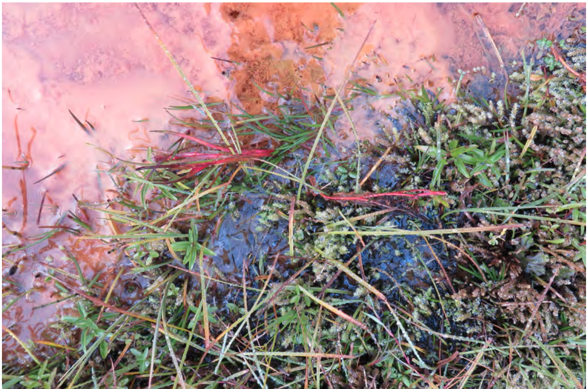
21. mynd. Laugasef sem er hitakær æðplöntutegund vex í volgru í Ásgarði. Ljós. Rannveig Thoroddsen, 29. september 2016.