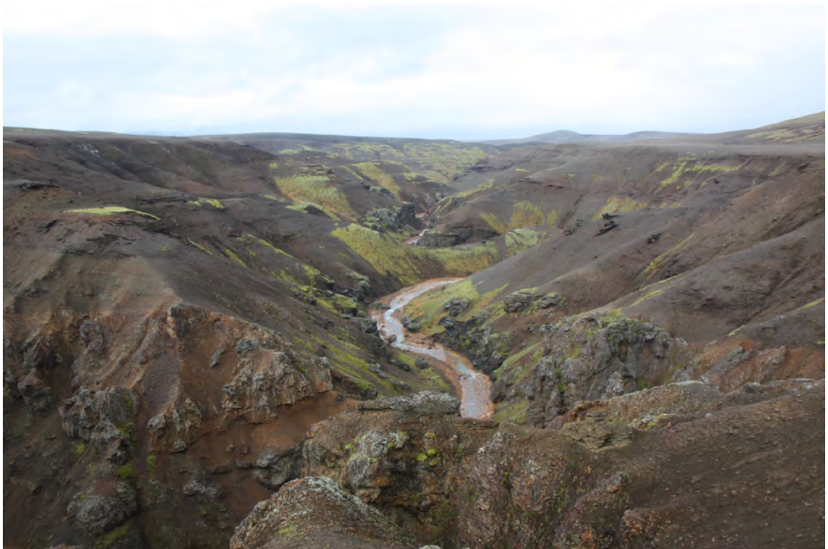
7. mynd. Árskarðsá hefur grafið djúpt og tilkomumikið gljúfur í setlög og móberg í Árskarðsöldum. Ljósmynd. Kristján Jónasson, 30. sept. 2016.