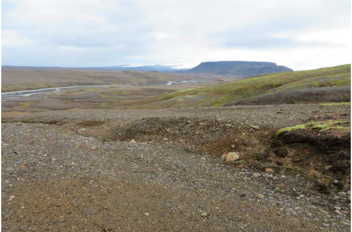
9. mynd. Ógrónir melar með misgisinni gróðurþekju í lægdum og dældum einkenna svæðið við Kerlingarfjöll, líkt og víðar á miðhálandinu. Jökulkvísl/Jökulfall rennur frá Hofsjökli sem er í baksýn handan við fjallið Blánípu. Ljós. Rannveig Thoroddsen, 30. september 2016.

Gróíð land, þ.e. land með meira en 10% gróðurþekju, er 37% af flatarmáli athugunarsvæðisins (1. viðauki). Gróðurþekja er þó víðast gisin og um helmingur gróna landsins er aðeins með fjórðungs gróðurþekju (2. viðauki) Algróíð land, með yfir 90% þekju að meðaltali, er 20% og er þar aðallega um að ræða mosagrónar hlíðar Árskarðsfjalls og votlendisfláka á undirlendi neðan þess.