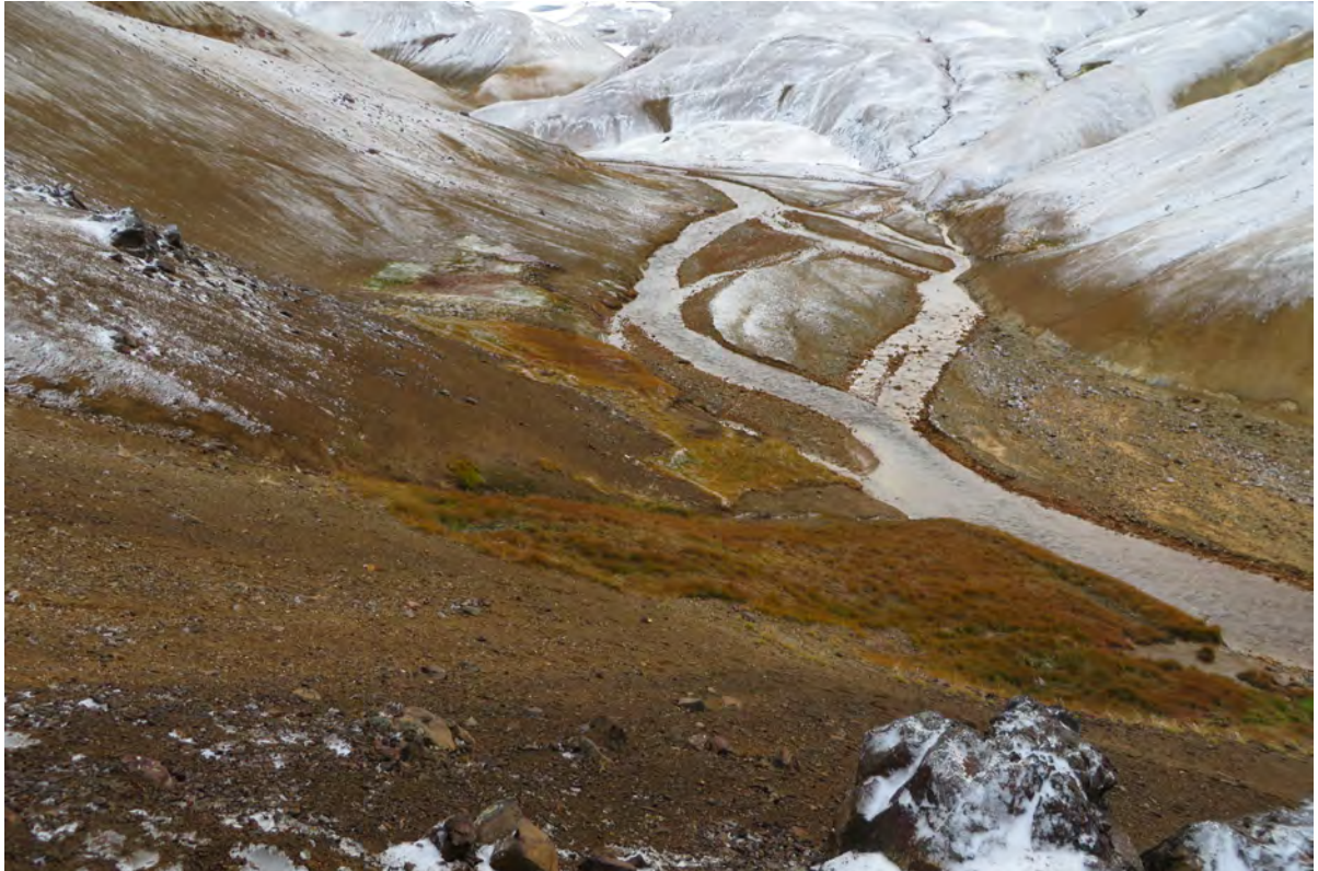
11. mynd. Gróskulegur mýrargróður í Hveradölum þar sem áhrifa jarðhitans gætir. Ljós. Rannveig Thoroddsen, 30. september 2016.