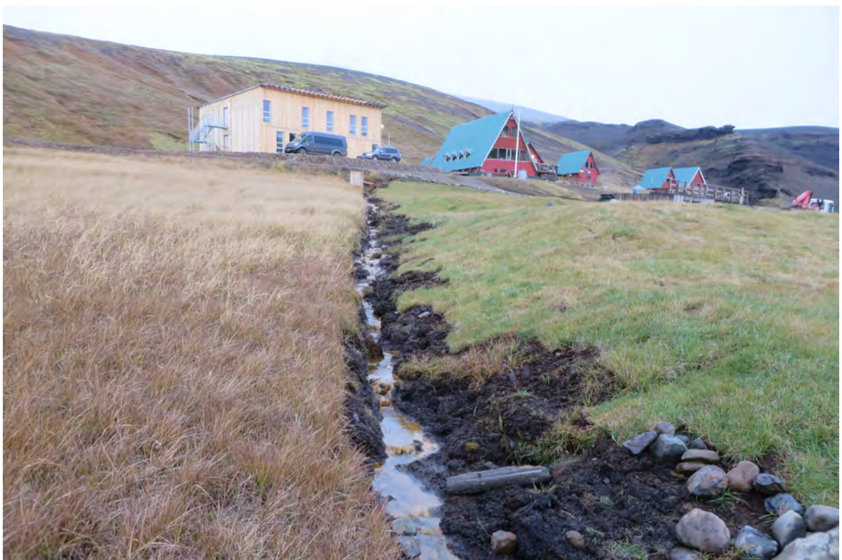
16. mynd. Þar sem loka hefur þurft sárum eftir jarðrask hafa sums staðar verið lagðar túnþökur sem stinga nokkuð í stúf við umhverfið. Ljós. Rannveig Thoroddsen, 29. september 2016.