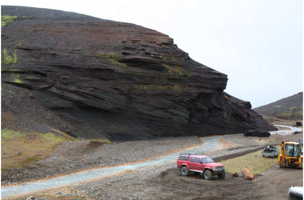
6. mynd. Í Árskarðsöldum eru þykk og víðáttumikil lög af lóna- og straumvatnaseti frá ísöld. Ljósmynd. Kristján Jónasson, 29. sept. 2016.