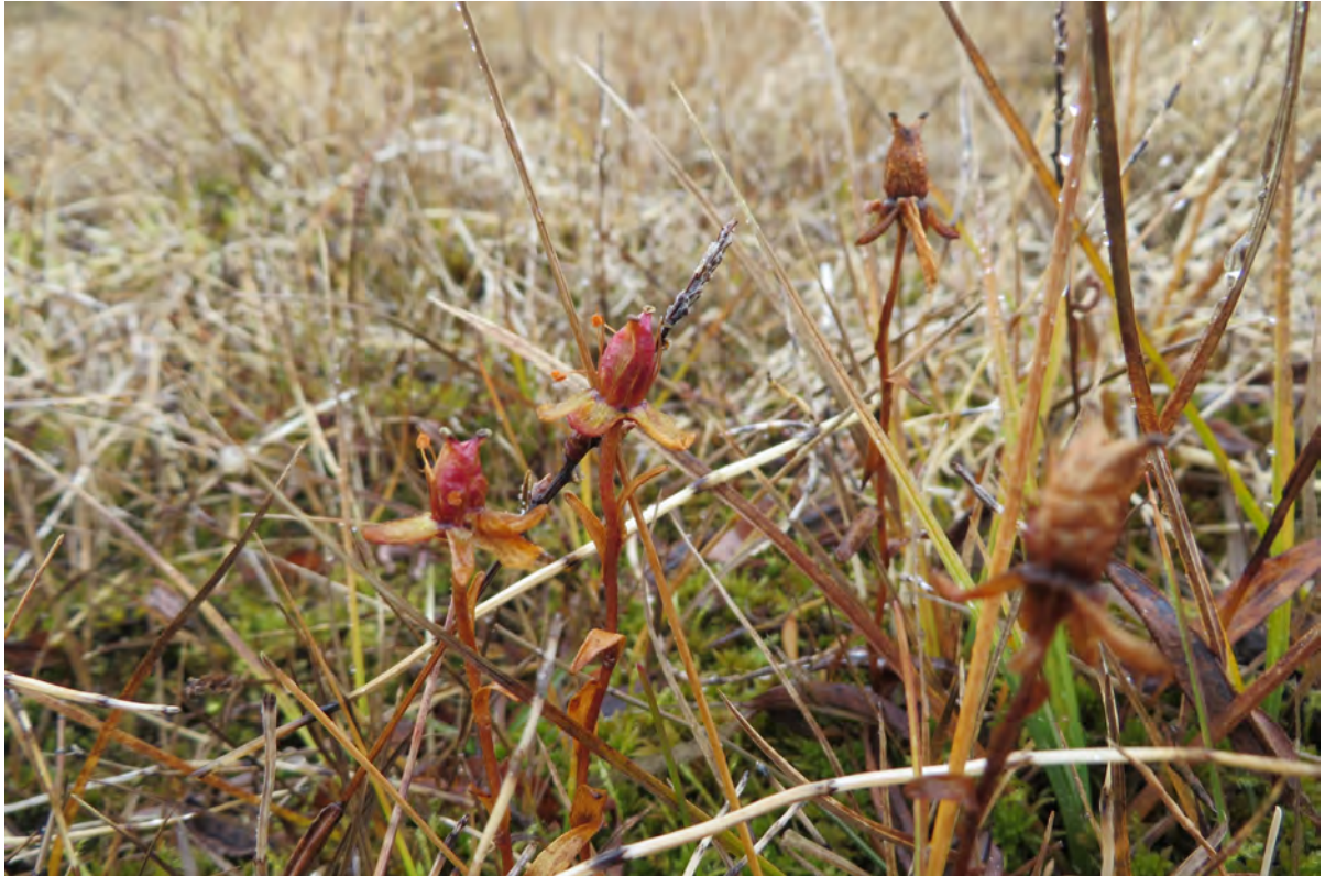
20. mynd. Þroskuð aldin gullbrár sem vex í mýri ofan við aðaltjaldsvæðið í Ásgarði. 29. september 2016.