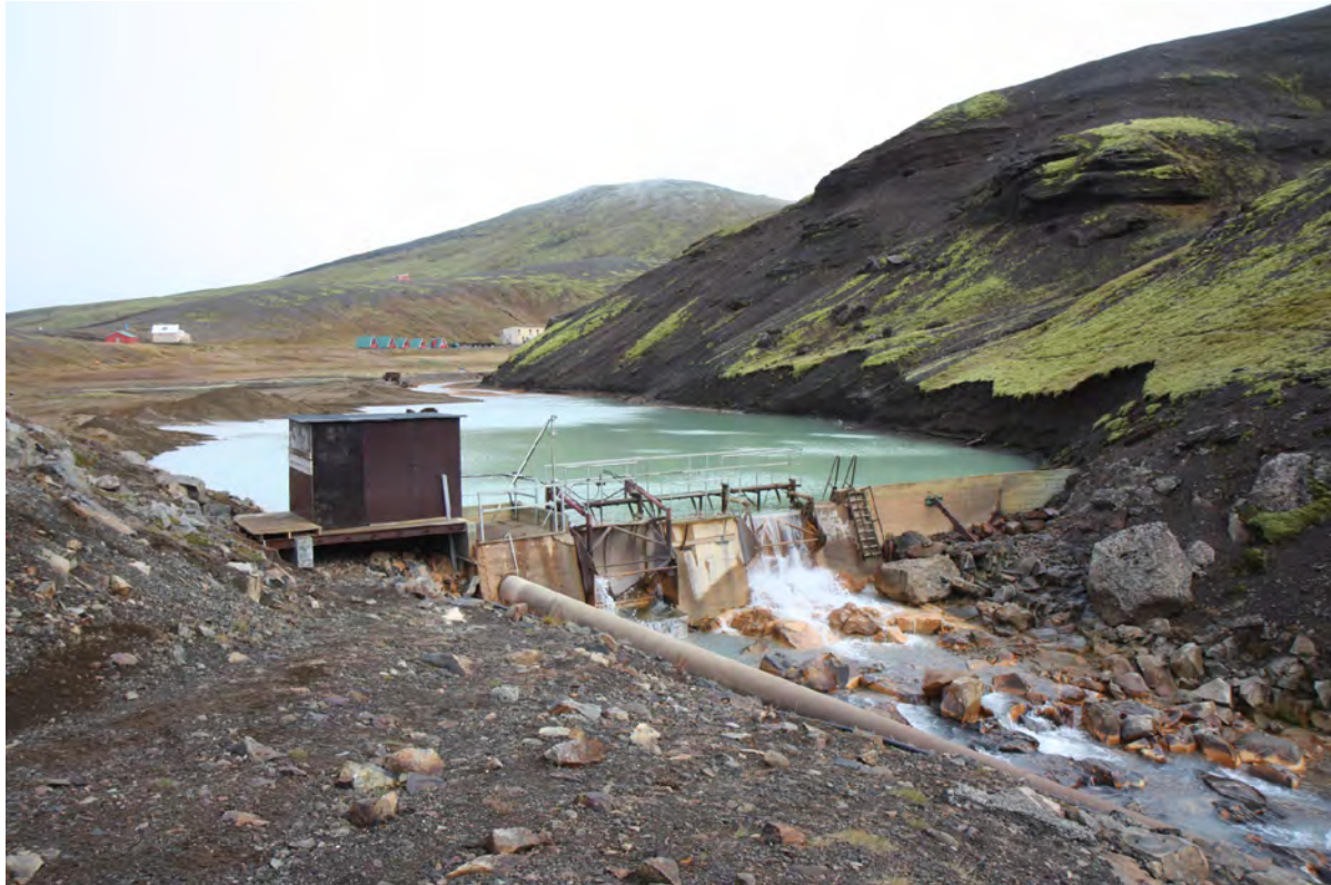
23. mynd. Vatnsaflsvirkjun í Sælufossi rétt neðan við Ásgarð. Ljósmynd. Kristján Jónasson, 29. sept. 2016.

Æðplöntur. Engar skráðar æðplöntutegundir innan athugunarsvæðisins eru á válista eða eru friðaðar. Á svæðinu eru aðeins þrjár tegundir æðplantna sem hafa hærra verndargildi en 3. Það eru rauðstör Carex rufina og fjandafæla Omalotheca norvegica sem hafa verndargildið 4 og hjallasveifgras Poa x jemtlandica með verndargildið 6. Tegundirnar þrjár eru að mestu bundnar við snjóþung svæði á hálandinu og til fjalla. Fjandafæla fannst einnig innan lóðar Fannborgar í Ásgarði.