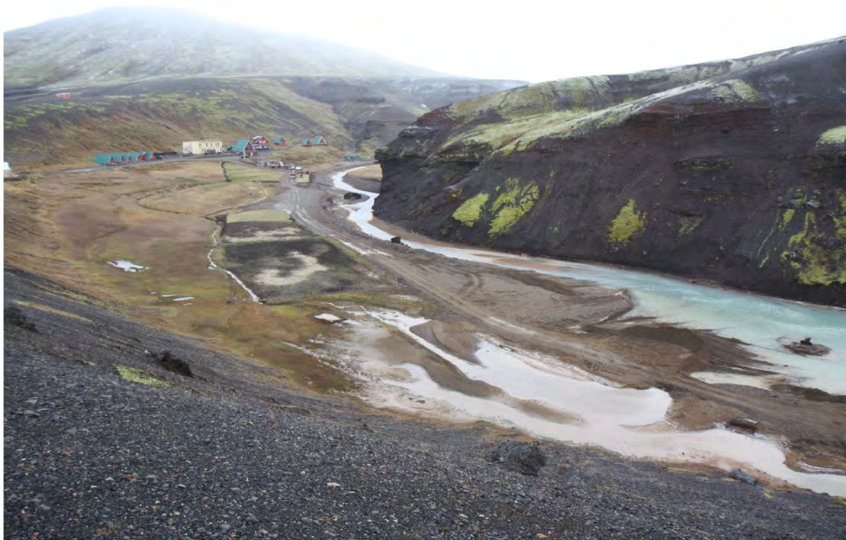
25. mynd. Efnistökusvæði í inntakslóni Sælufossvirkjunar. Vanda þarf frágang eftir efnistöku. 29. september 2016.