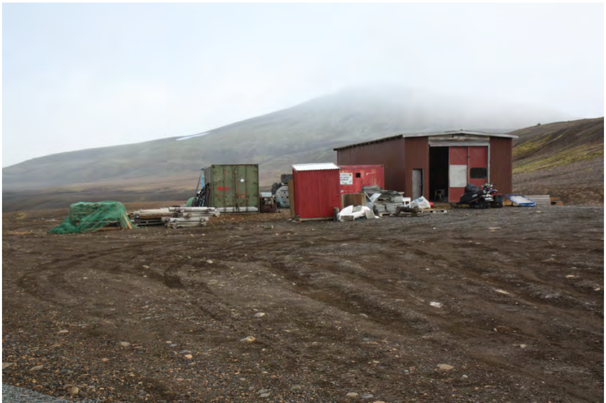
28. mynd. Byggingarefni o.fl. við svokallaðan Spítala, sem er á mjög áberandi stað rétt utan við Ásgarð. Ljós. Kristján Jónasson, 29. september 2016.