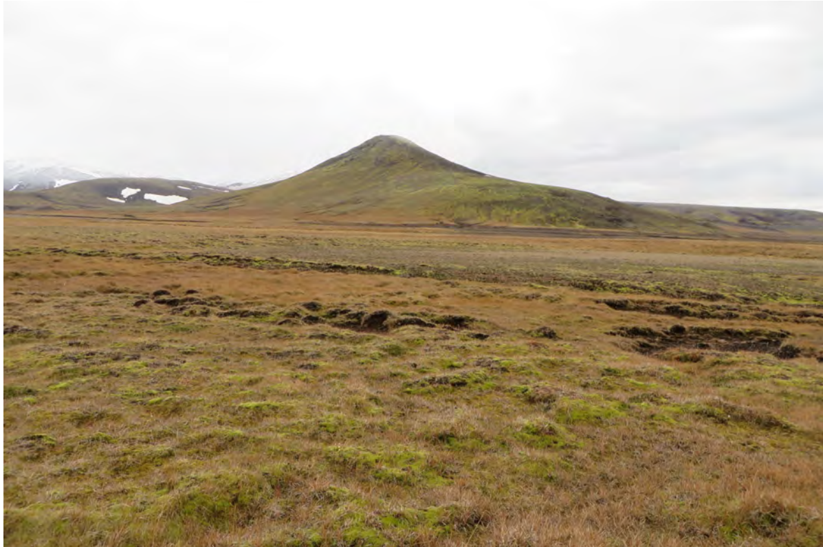
10. mynd. Starmói og mýrarflákar á flatlendinu framan og neðan við mosagróið Árskarðsfjall. Ljósmynd Rannveig Thoroddsen, 30. september 2016.

þeim bletti og graslendi komið í staðinn. Grasþökur hafa einnig verið lagðar á nokkrum stöðum í Ásgarði (16. mynd).