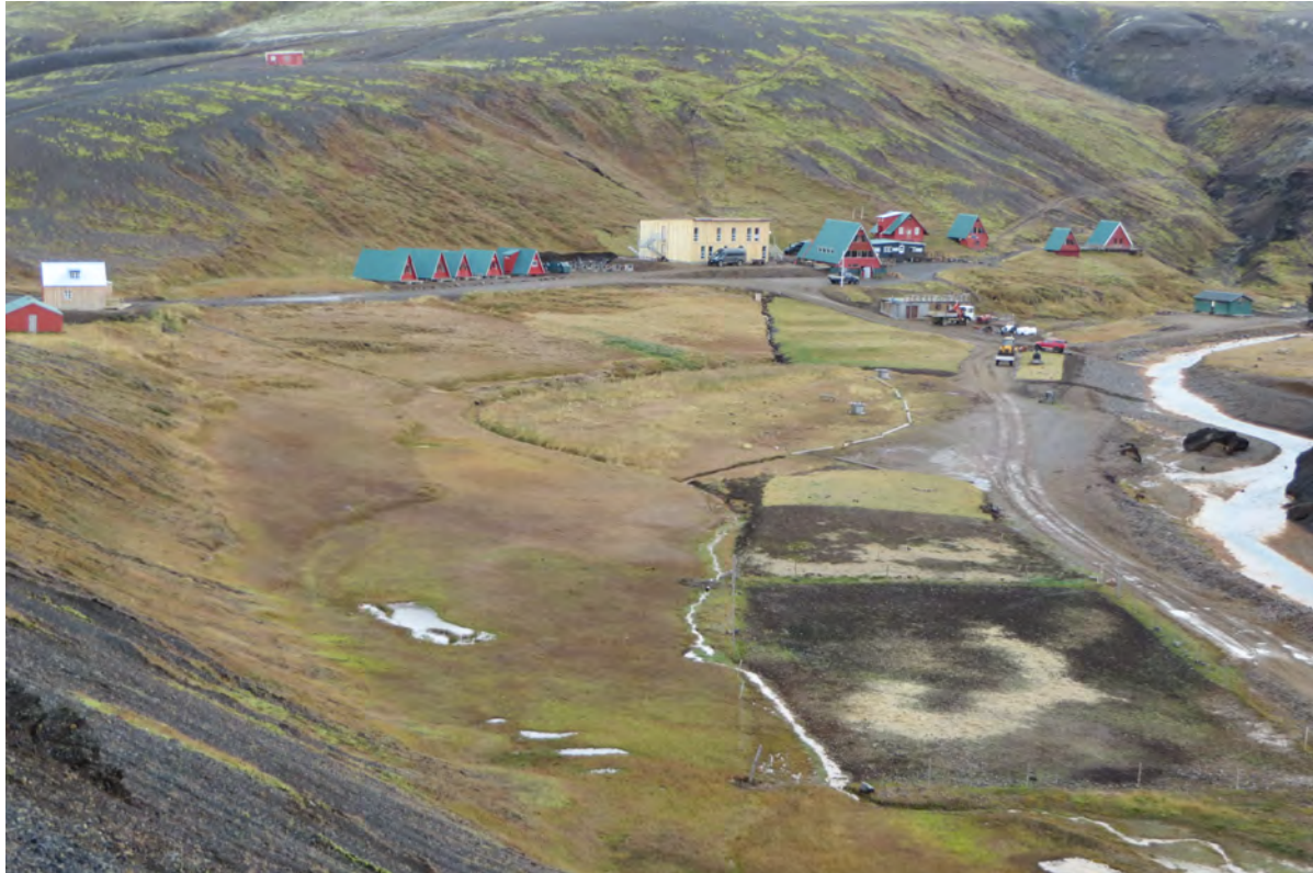
13. mynd. Graslendi, mýri og starmói eru ríkjandi gróðurlendi í Ásgarði. Ljós. Rannveig Thoroddsen, 29. september 2016.