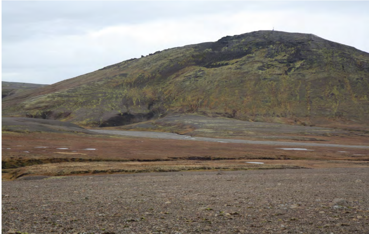
2. mynd. Árskarðsfjall er ungleg móbergsmyndun í jaðri Kerlingarfjalla. Ljós. Kristján Jónasson , 30. sept. 2016.