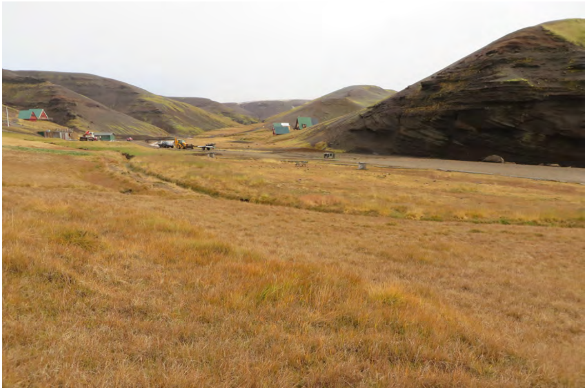
15. mynd. Á aðaltjaldsvæðinu í Ásgarði hefur graslendi tekið við af votlendinu sem þar var áður. Framræsluskurður var grafinn um 1970. Ljós. Rannveig Thoroddsen, 29. september 2016.