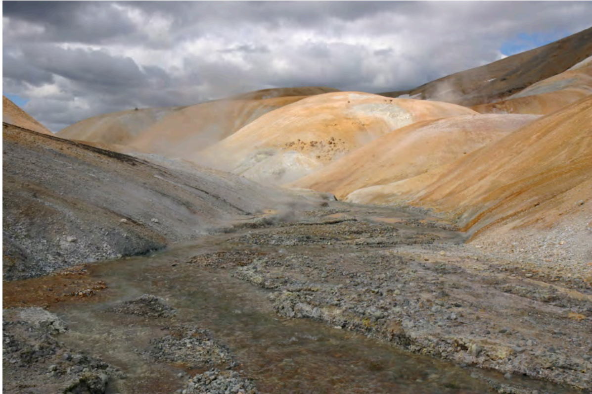
4. mynd. Öflug hveravirkni við Árskarðsá í austurhluta Hveradala. Ljós. Kristján Jónasson, 6. júlí 2008.