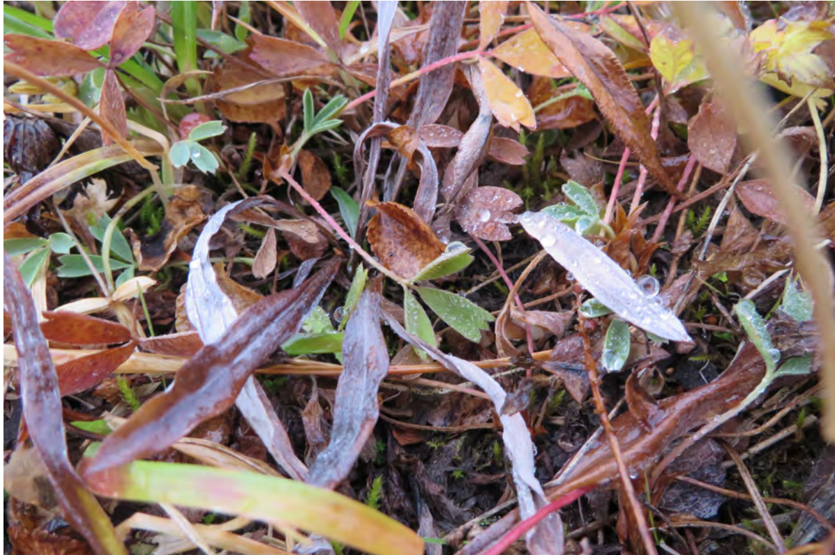
19. mynd. Þó að komið væri fram á haust og gróður tekinn að sölna þá má enn greina tegundir eins og fjallasmára og fjandafælu sem hér vaxa í blómasnjódæld í skjólgróðri brekku í Ásgarði. Ljósmynd. Rannveig Thoroddsen, 29. september 2016.

útbreiðslusvæði hennar. Af 87 tegundum æðplantna sem fundust í Ásgarði voru 17 tegundir sem höfðu ekki verið skráðar áður innan athugunarsvæðisins í gagnagrunn Náttúrufræðistofnunar Íslands. Má t.d. nefna tegundir eins og tjarnastör og gulstör sem báðar eru hávaxnar starir og eru auðgreinanlegar þar sem þær vaxa í breiðum í mýrum og flóum líkt og í Ásgarði (22. mynd).