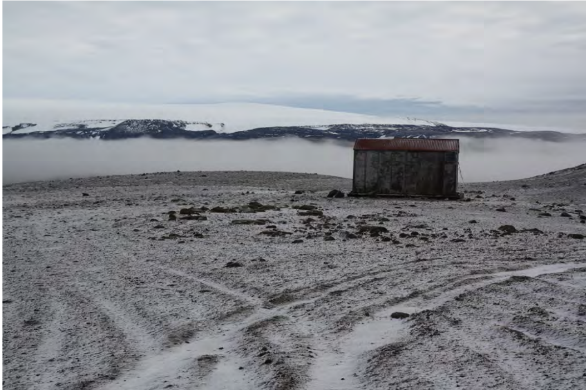
29. mynd. Lítill ónotaður kofi (Nígería) neðan við Keis. 30. september 2016.