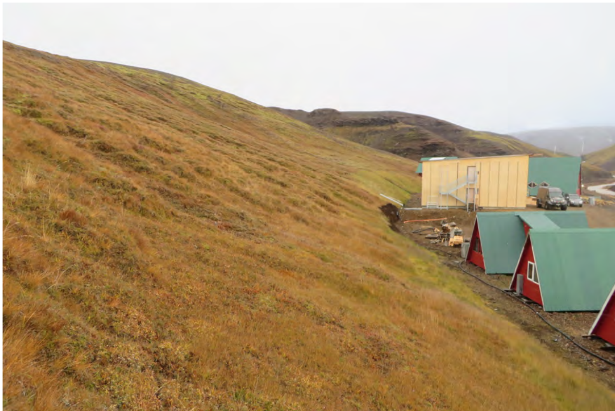
14. mynd. Í brekkunni ofan við nípunar og nýbygginguna eru nýlagðar grasþökur til að loka sárum eftir jarðrask enn áberandi en munu að öllum líkindum samlagast smám saman nærliggjandi gróðri. Ljós. Rannveig Thoroddsen, 29. september 2016.