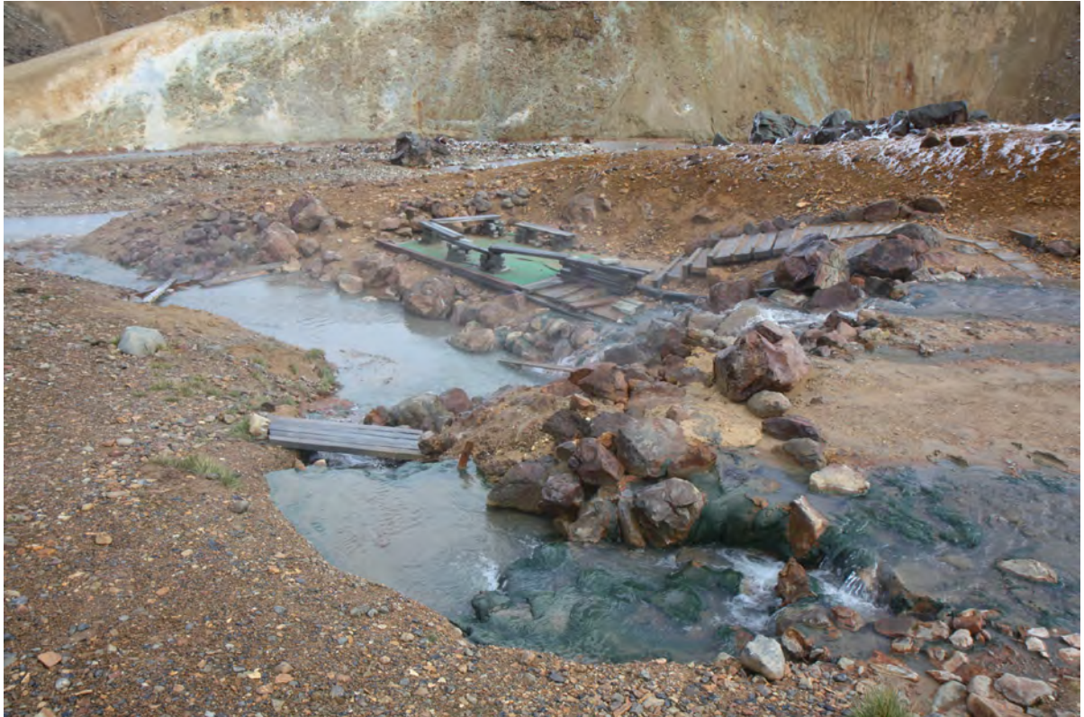
27. mynd. „Villibað“ hefur verið útbúið í Vesturdölum. Það fyllist jafnóðum af aur og nýtist illa. Heppilegast er að fjarlægja það og ummerki þess. 30. september 2016.