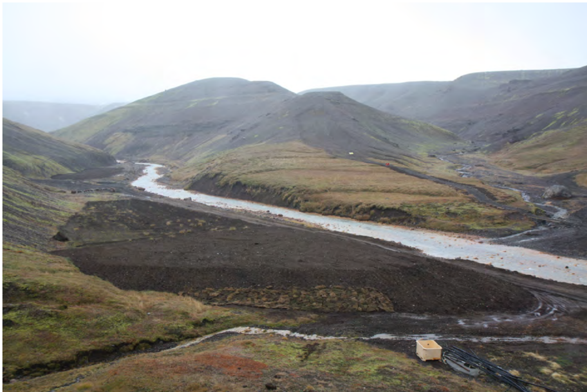
30. mynd. Manngerður malarhjalli og moldarslétta suður af skálasvæðinu í Ásgarði. Varhugavert er að búa til gervilandslag á svæðinu. Ljós. Kristján Jónasson, 29. september 2016.