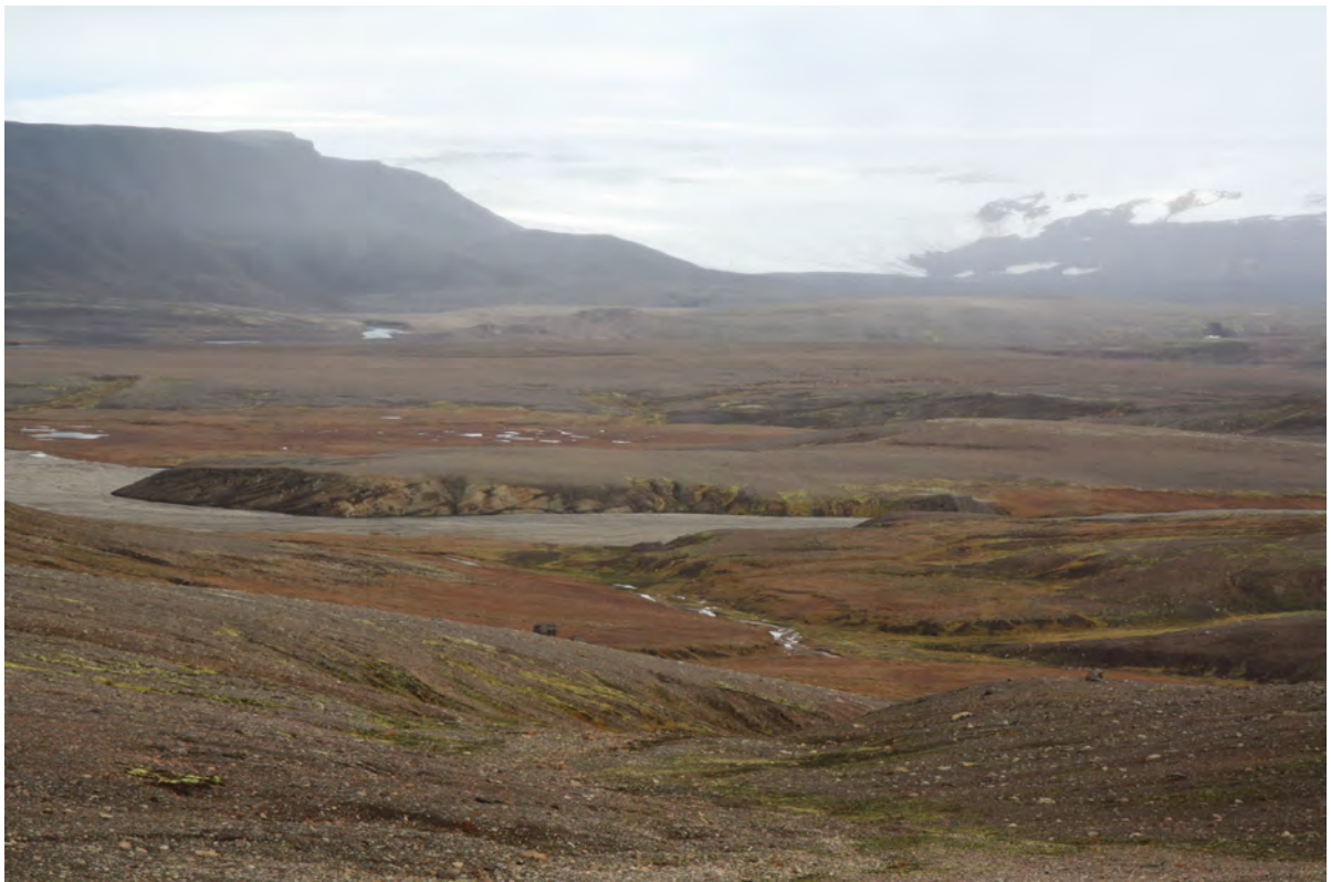
12. mynd. Séð yfir samfellt votlendi austan Kerlingarsprænu, sunnan við Árskarðsfall, í átt að Blánípu en annars einkennist gróðurfar svæðisins af gisnum hélumosagróðri. 30. september 2016.