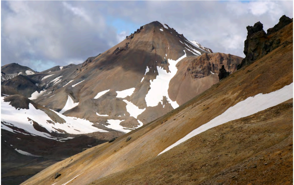
3. mynd. Ögmundur er líparítstapi í vestri líparíthyrpingu Kerlingarfjalla.