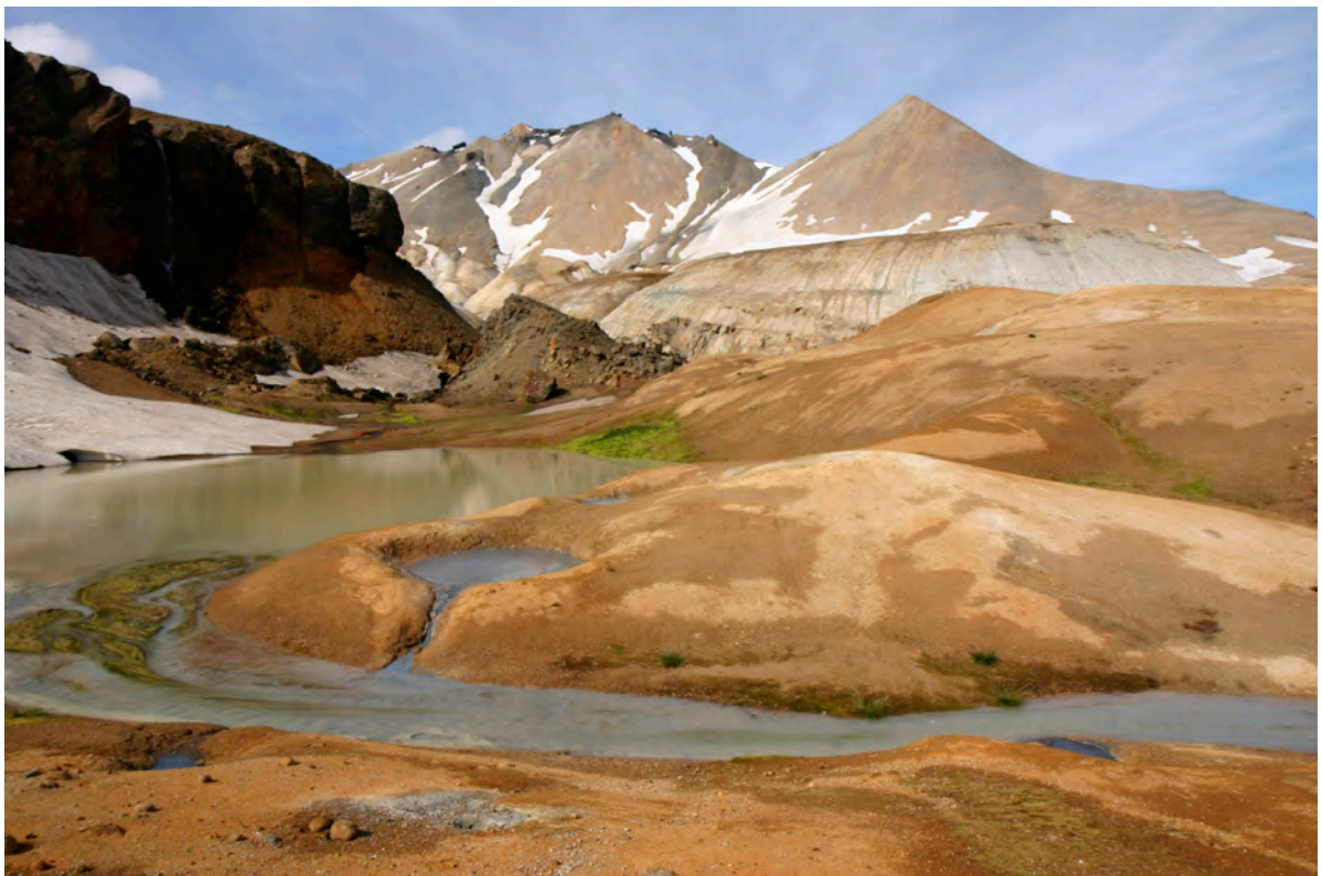
1. mynd. Í Efri Hveradölum er litríkt háhitasvæði innan um háreist líparítfjöll og móberg. Hér er ungleg móbergsmýndun til vinstri og líparítfjöllin Snækollur (1488 m y.s.) og Snót í bakgrunni. Ljósmynd. Kristján Jónasson, 7. júlí 2008.

Kerlingarfjöll eru allmikill fjallabákur skammt suðvestur af Hofsjökli. Svæðið er fjöllótt og hálent, hæstu fjöll yfirleitt um 1200–1400 m. Mikil líparítfjöll einkenna svæðið ásamt lægri móbergsfjöllum. Kerlingarfjöll eru megineldstöð með allmiklu háhitasvæði um miðbikið (1. mynd). Tvær öskjur eru greinanlegar innan Kerlingarfjalla.