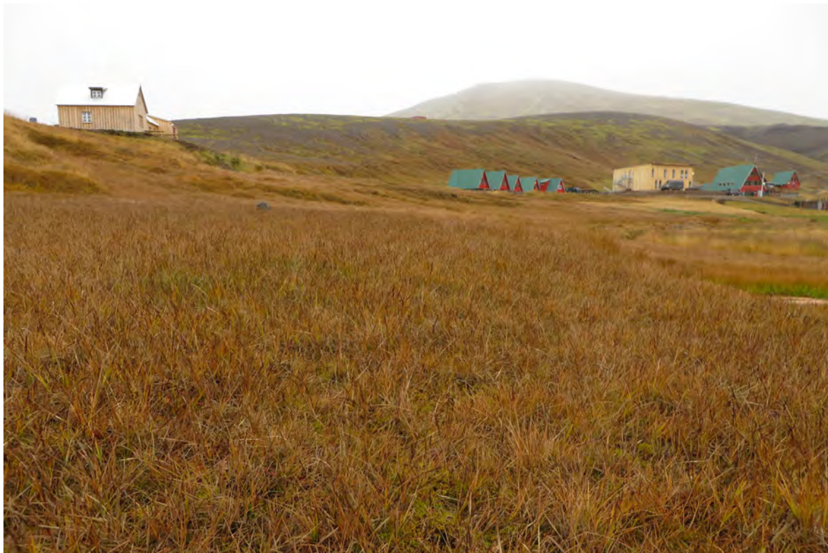
18. mynd. Stinnustaramýri þar sem stinnastör er ríkjandi, ýmist ein eða með öðrum einkennandi fylgitegundum, t.d. hengistör, er algengasta mýragerðin í Ásgarði. 29. september 2016.