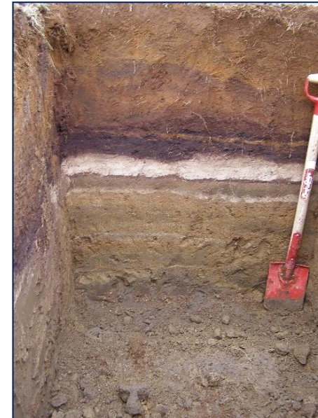
Djúpur grasmói sem færi í I. flokk ef halli og þurrkstig er í lagi.