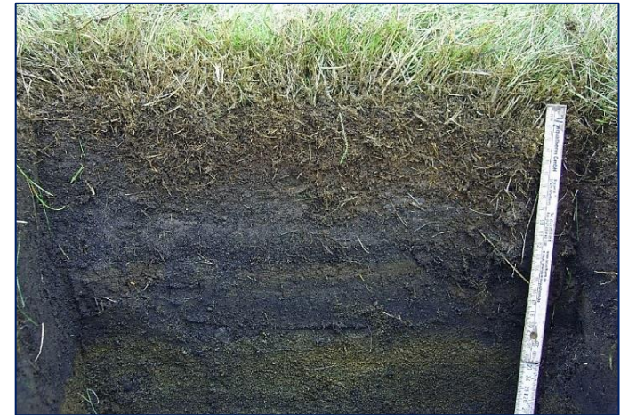
Sandur með litlu lífrænu efni. Færi í II. flokk ef hann er djúpur og ekki mjög grófur en annars í III.flokk (mynd G.P.P).