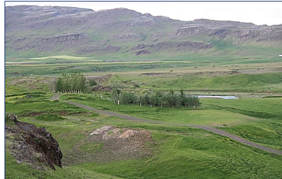
Óslétt og rýrt land sem að líkindum myndi falla í IV. flokk (mynd EFLA)