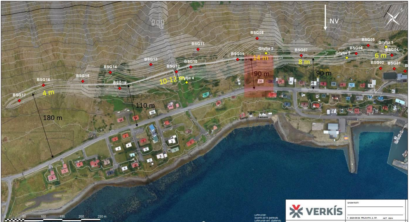
Mynd 1. Fjarlægðir garðs frá vegi.