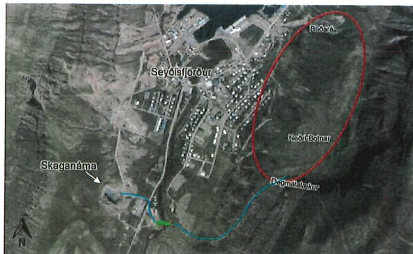
Mynd 5.2 Staðsetning Skaganámu ásamt staðsetningu framkvæmdasvæðis ofanflóðavarnargarða (rauður hringur).