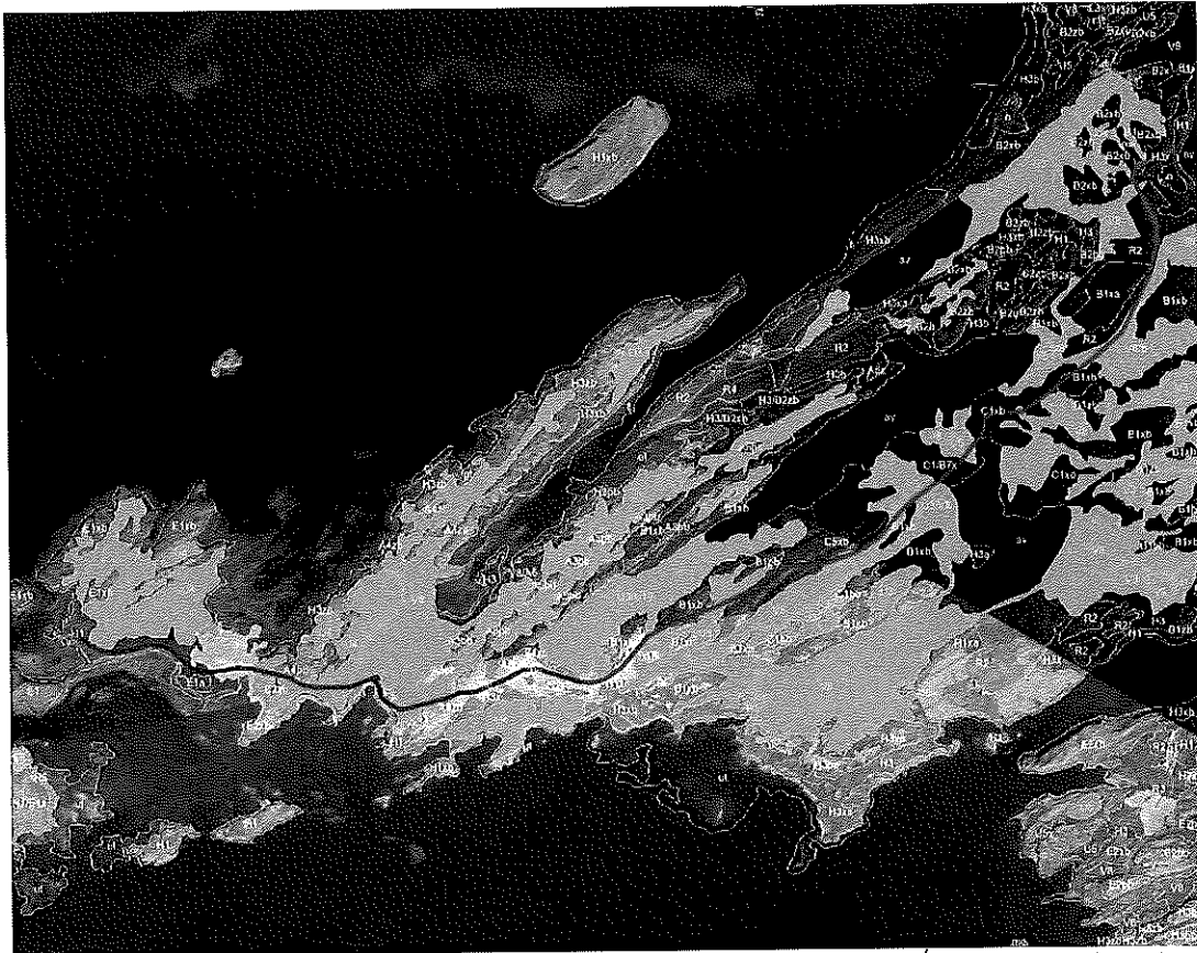
1. mynd. Gróðurkort með áætluðu vegstæði. Votlendi og sjávarfitjar skv. gróðurkorti NÍ er sýnt sem gulir (votlendi) og bláir (fitjar) flákar. Blá lína: núverandi vegur sem nýr vegur er tengdur inn á (0,7 km). Rauð lína: nýtt vegstæði (3,2 km). Fjólublá lína: eldra vegstæði sem verður lagað til (2,4 km).

Ekki kemur fram í greinargerðinni ástæða þess að til stendur að leggja nýjan veg frá Skálholti að Kolaborg í stað þess að fylgja gömlu slóðinni á milli Skálaholts og Hofstaða en hún þræðir grösuga kamba meðfram ströndinni og lítt gróna mela.