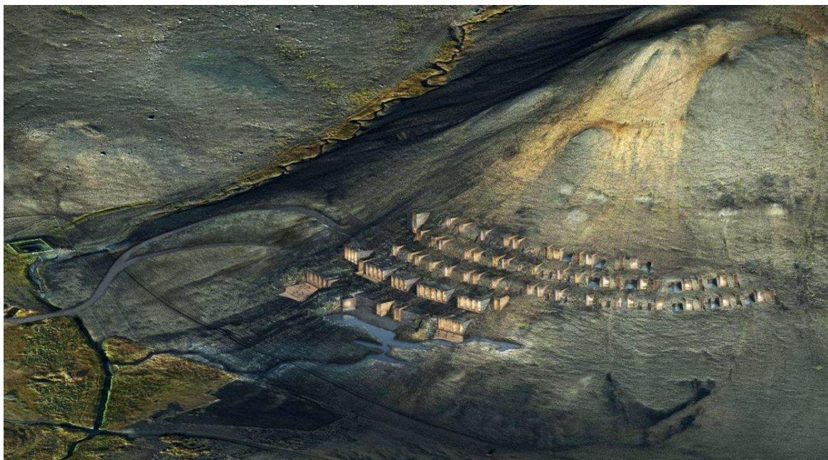
Mynd 2. Horft til norðurs yfir þann hluta hótelsins sem verður sýnilegur á yfirborði og baðstaðinn. (Úr tilkynningu framkvæmdaraðila)

Fram kemur að á svæði B verði móttaka gesta í um 300 m 2 þjónustubyggingu og malarbílastæði sem muni rúma 100 bíla og 3-5 rútur. Framkvæmdaraðili mun sjá um að flytja alla gesti frá svæði B að svæði A með rafknúnum ökutækjum sem samkvæmt núverandi áætlunum séu um 5 tonn að þyngd og rúmi 14 farþega.