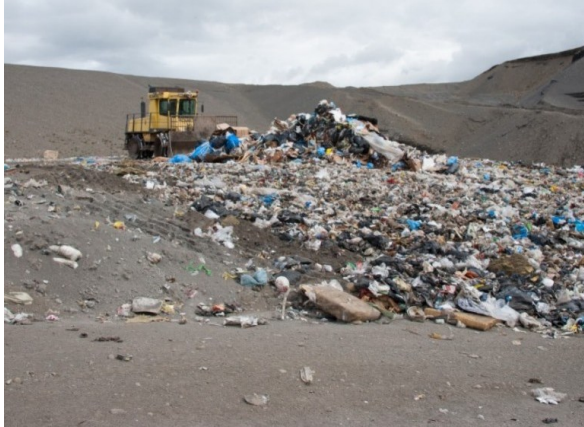
MYND 6 Vinnuvél að störfum í Stekkjarvík [1].