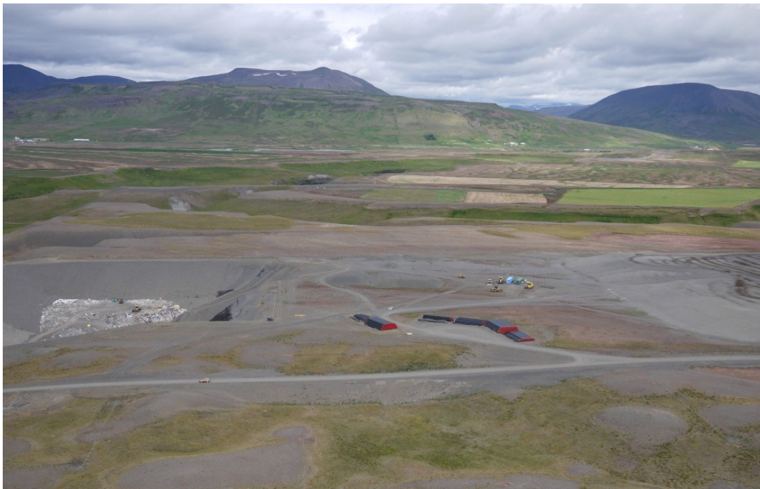
MYND 3 Urðunarstaðurinn í Stekkjarvík í landi Sölvabakka.

Norðurá leigir landið í Stekkjarvík af landeigendum Sölvabakka og gildir leigusamningurinn til ársins 2038. Urðað hefur verið á svæðinu síðan 2011.