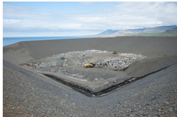
MYND 9 Urðunarstaðurinn í Stekkjarvík [1].