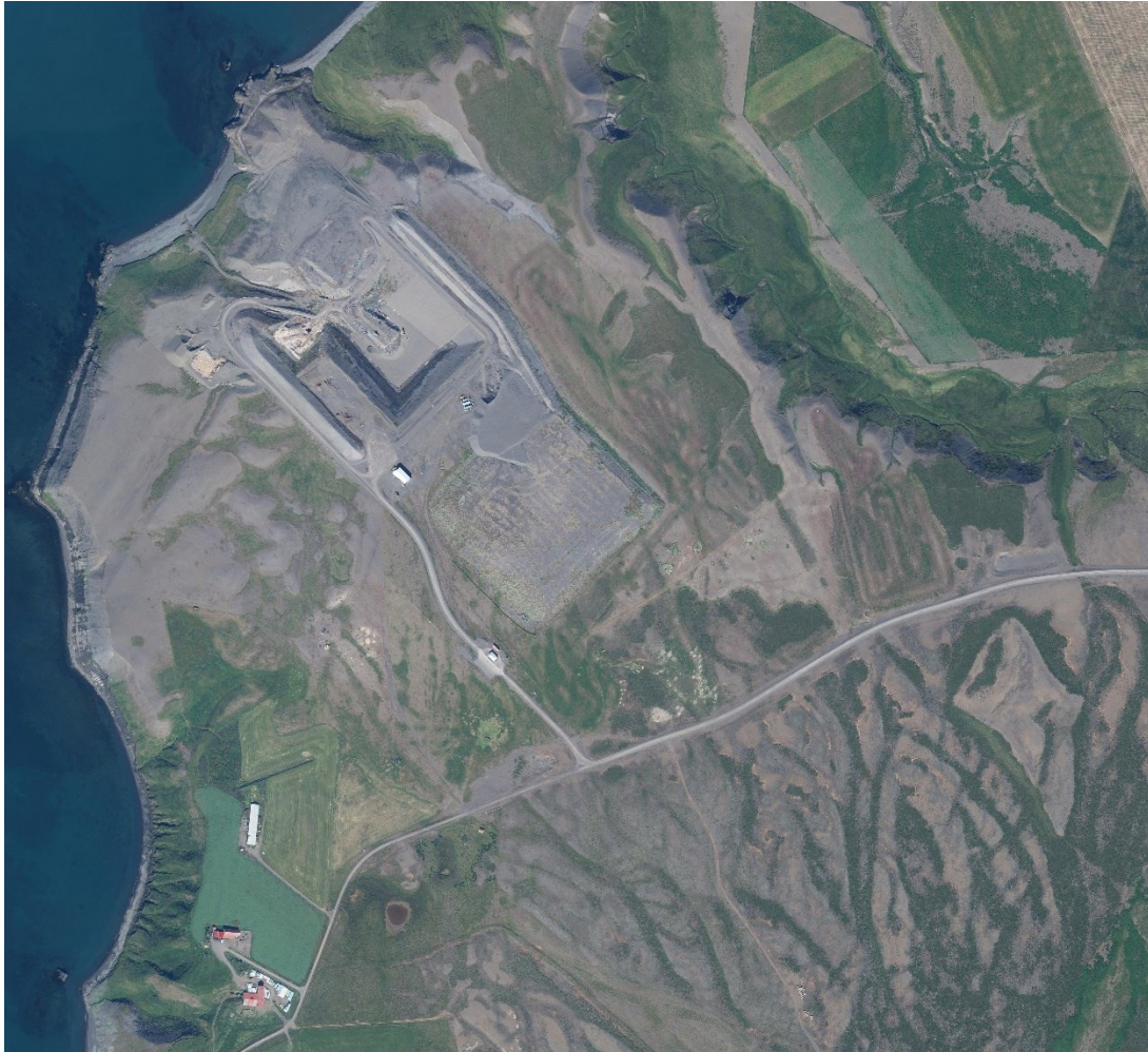
MYND 4 Urðunarstaðurinn og bærin Sölvabakki. 560 m eru frá urðunarstaðnum að íbúðarhúsi á Sölvabakka.