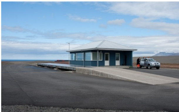
MYND 8 Þjónustuhúsið á þjónustuplaninu og bílavog [1].