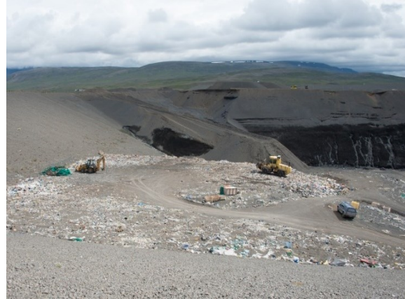
MYND 7 Vinnuvél í Stekkjarvík [1].