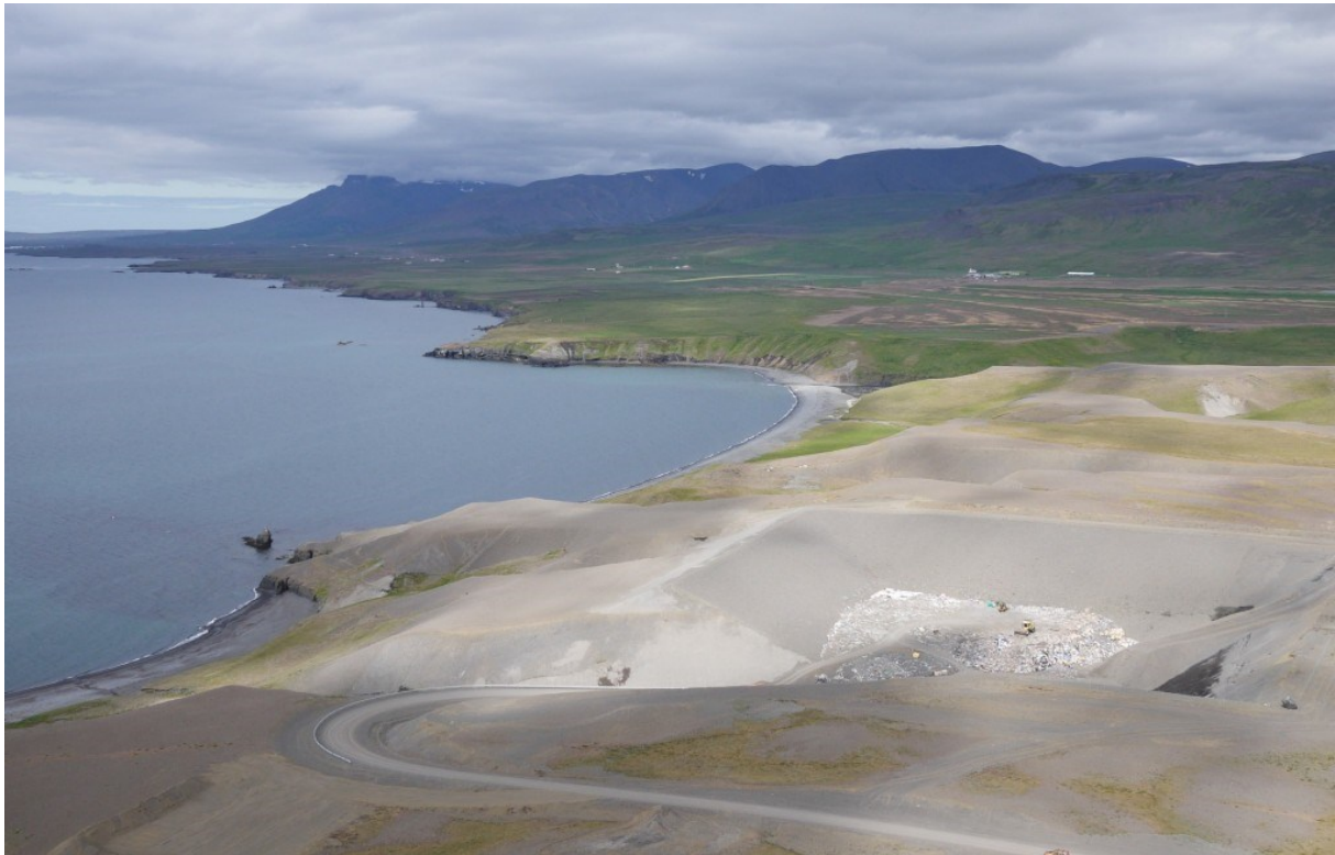
MYND 1 Yfirlitsmynd af urðunarstaðnum í Stekkjarvík, Blönduósi.

Byggðasamlagið Norðurá bs áformar að auka við urðun á urðunarstaðnum í Stekkjarvík í landi Sölvabakka, Blönduósi úr 21.000 tonnum af heimilis- og rekstrarúrgangi á ári hverju í 30.000 tonn, sem samsvarar aukningu um samtals 9.000 tonn á ári. Ekki er um að ræða aukningu á heildarmagni urðaðs úrgangs í Stekkjarvík, sem eftir sem áður er áætlaður 630.000 tonn í lok rekstartímans árið 2038.