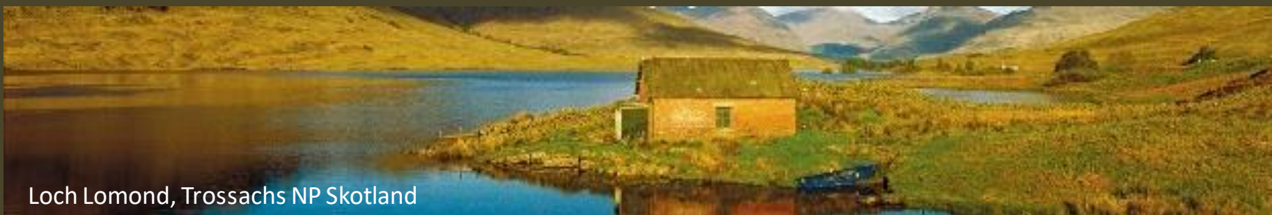
Loch Lomond, Trossachs NP Skotland