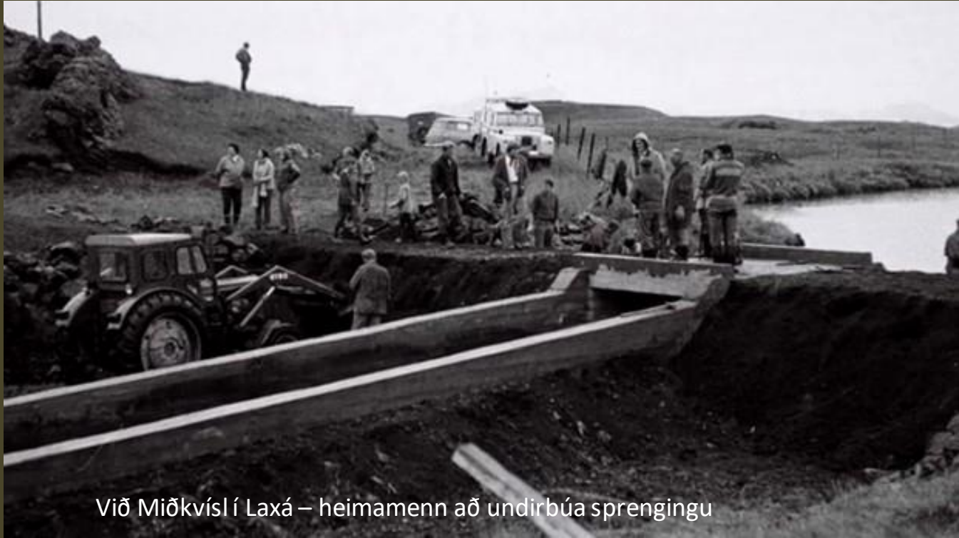
Við Miðkvísl í Laxá – heimamenn að undirbúa sprengingu