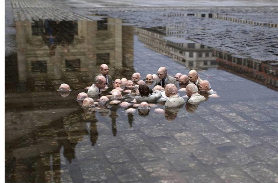
“Politicians debate Global Warming” e. Isaac Cordal