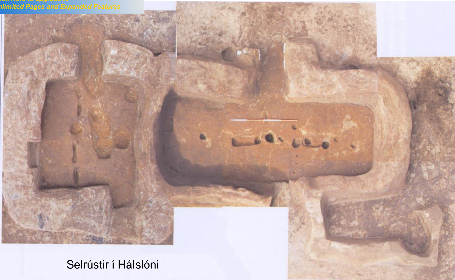
Selrústir í Háslóni