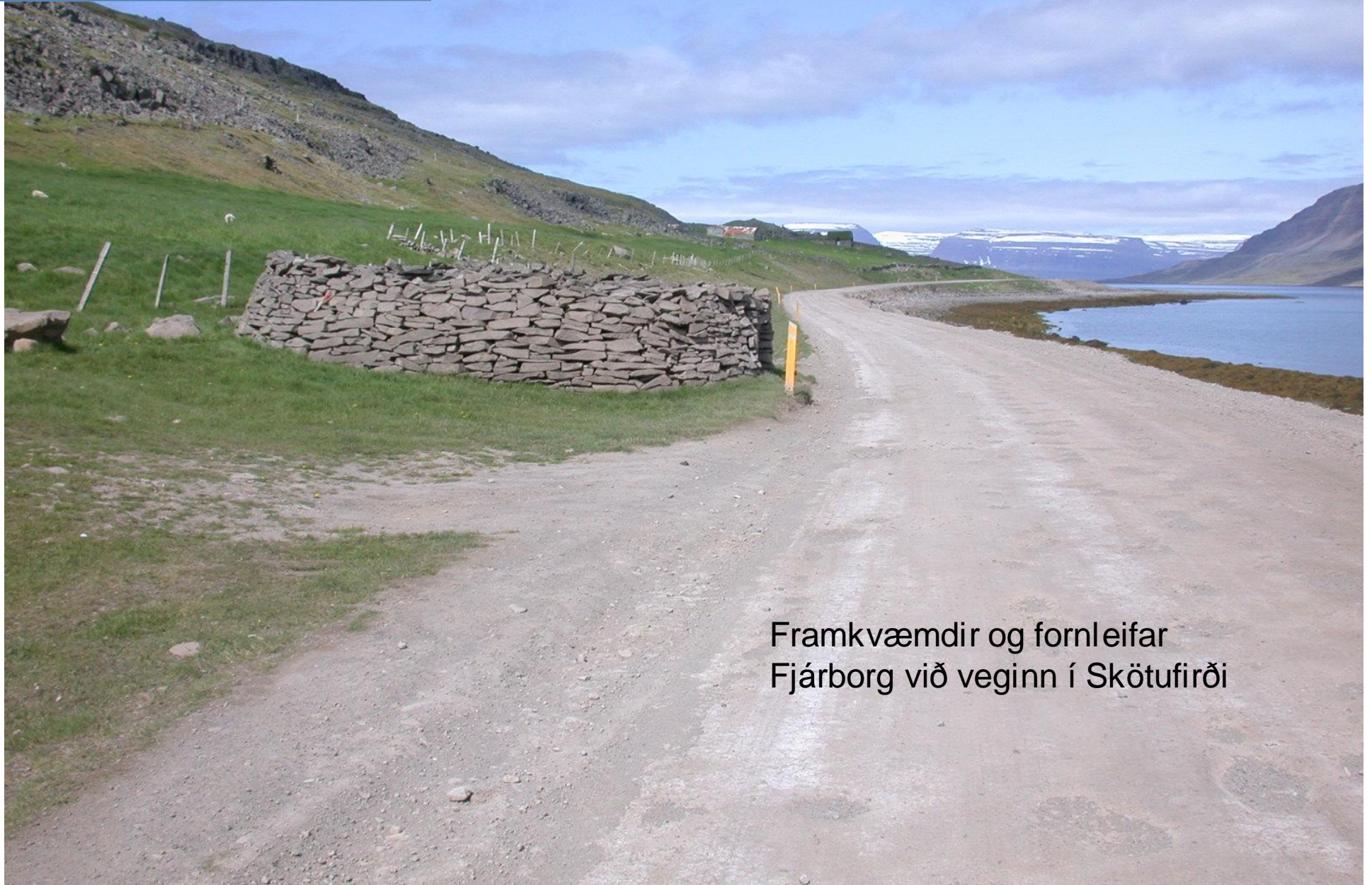
Framkvæmdir og fornleifar Fjárborg við veginn í Skötufirði