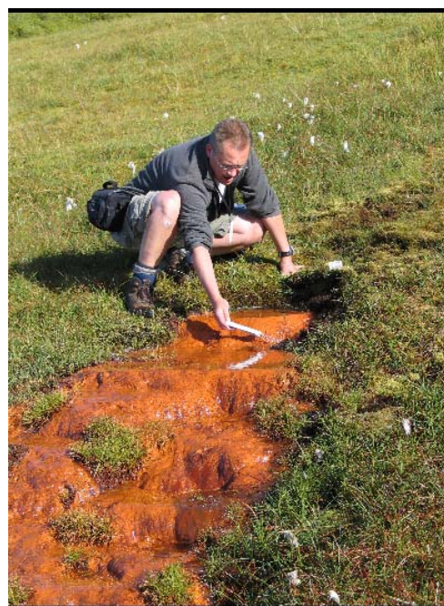
Mynd 1: Volg ölkelda

Styrkur efna í borholuvökvanum er í samræmi við hitastig og er hann því nokkru lægri en þekktist í holum á Helliheiði og Nesjavöllum. Þó er sú endantekning að styrkur CO 2 í holum HE-2 og HE-20 er mjög hár í djúpvatninu (um 3200 mg/kg í báðum holum). Þetta er mun hærra styrkur en búast má við við það hitastig sem ríkir í holunum en það er á bilinu 50 – 500 mg/kg. Styrkur CO 2 í djúpvatni í holu HE-22 er nær jafnvægisástandi, en styrkurinn mælist 860 mg/kg. Líkleg skýring á yfirmagni að CO 2 í eystri hluta Bitrusvæðisins er að undir því sé heitt jarðhitakerfi sem er í suðu og veiti CO 2 í grynna kerfið sem að hluta til leysist þar upp og valdi ójafnvægi og að hluta til nær gasið yfirborði og veldur fjölmörgum heitum og volgum ölkeldum á svæðinu (mynd 1).