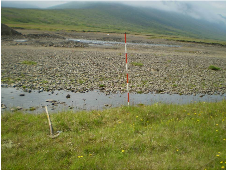
Mynd 3 Eyrar neðan við Kirkjuból