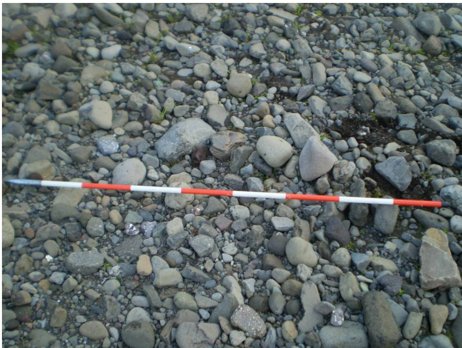
Mynd 2 Dæmigerð kornadreifing ármalar Norðfjarðarár.